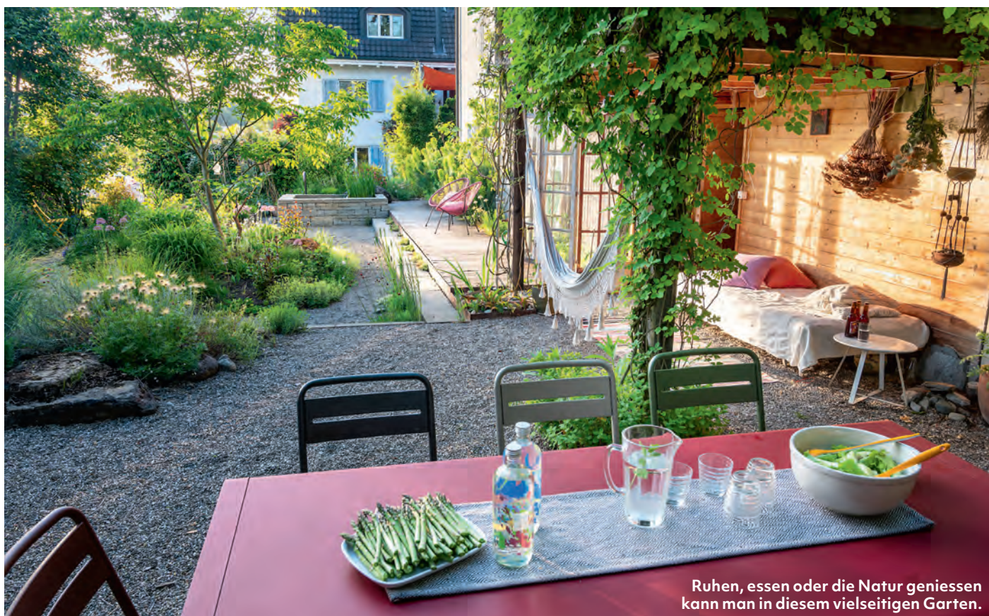
Ruhen, essen oder die Natur genießen kann man in diesem vielseitigen Garten.