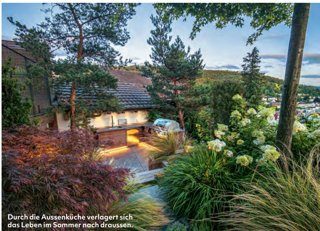
Durch die Aussenküche verlagert sich das Leben im Sommer nach draussen.

Wie gestaltet man einen Garten, wenn es dafür nur einen umlaufenden schmalen Streifen gibt, die ineinander verschachtelten Gebäude fast das ganze Grundstück einnehmen und das Gelände steil ist? Selbst unter solchen Bedingungen lässt sich mit Kreativität, Fachwissen und einer präzisen Umsetzung ein Garten erschaffen, der Geborgenheit und gleichzeitig eine Erlebniswelt bietet. Das beweisen die beiden Landschaftsarchitekten Robin Lustenberger und Jan Schelling (LSLA GmbH) in diesem 250 m 2 grossen Hanggarten mit Blick über die Aargauer Hügellandschaft. Eine entscheidende Rolle spielt dabei die Bepflanzung, die so wohltuend mit der kantig-formalen Gestaltung kontrastiert und den Garten mit Leben erfüllt. Dieser verteilt sich wegen der Terrassierung auf zwei Ebenen, die mit Treppen und Rampen verbunden sind. Ziel der Planung war, die kleinen Flächen besser nutzbar zu machen. Daher wurde die Terrassierung im Hauptgarten so angelegt, dass der Bereich Platz für eine Aussenküche mit Sitzbänken und einem Kräuterbeet bietet. Holzarbeiten verbinden die einzelnen Ebenen zu einem grossen Ganzen. Die Gartenbesitzer wünschten sich eine minimalistische Gestaltung mit formalen und klaren Belagsflächen aus Naturstein. Diese werden von weichen Pflanzflächen eingefasst, die nicht alles auf den ersten Blick offenbaren, um Lust auf eine Erkundungstour zu wecken. «Die Pflanzen bedecken einen Grossteil der Platten, der Weg weicht den Gewächsen»,